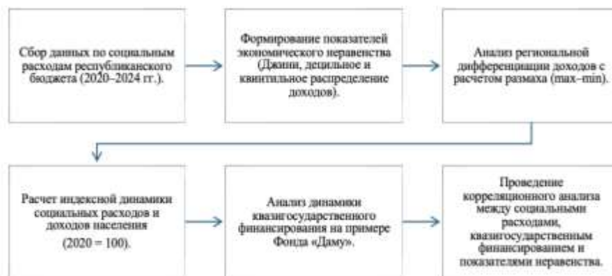
Рисунок 1 – Схема методологии эмпирического анализа

Методологическая основа исследования включает совокупность количественных методов, направленных на выявление взаимосвязей между государственными каналами финансирования и показателями экономического неравенства (рисунок 1).