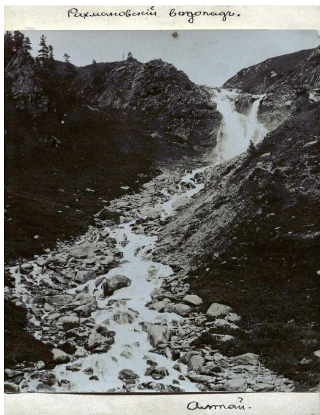
Рисунок 3 – Источник Рахмана. Фотография 1901 г.

Большинство людей приходят к Аулиебулаку для исцеления от болезней желудка, почек, от разных болезней кожи. Один из самых известных священных источников на Иртыше - источник Рахман. Рахмановский ключ находится на 32 км к северу от села Берел Катон-Карагайского района. Его длина 2,6 км, ширина 0,6 км, высота 1760 м над уровнем моря. Святость источника в казахском народе Ядринцев связывал с верой в Святого Духа. Он пишет: «Святые духи есть в каждой пещере, скале, озере и водопаде. В горячем Рахмановском ключе мы видели следы жертвоприношения» [25]. Ритуалы, посвященные Святому Духу, отражают святость Рахмановского ключа в традиционном мировоззрении казахского народа. В конце XIX - начале XX веков сюда стали массово приезжать другие народы, которые стали свидетелями чудодейственных целебных свойств источника. Приехавший в 1905 г. на базе специальной научной экспедиции Б. Герасимов писал: «Кажется, алтайцы могут вылечить все болезни водой Рахмана. Когда я спросил их, какие болезни можно лечить, они все согласились, что все больные, приехавшие на этот родник, вылечились с помощью вод этого родника» [26]. Приехавший сюда после Герасимова А. Белослюдов также организовал экспедицию. А. Белослюдов сделал фотофиксацию источника Рахмана в начале XX века (рис. 3).