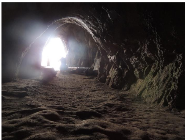
Рисунок 1 – Фотофиксация сакрального объекта Конур аулие Баянаульского края. Внутренний вид пещеры.

В среднем течении Иртыша, к северо-западу от Алтайских гор, в степи Сарыарка есть мелкосопочные Баянаульские горы, которые относятся сакральным местам ещё с древних тюркских времён. В труде М. Кашкари «Словарь тюркских слов», в котором отмечается, что слово «Байат» озаачает имя Великого Тенгри [12]. Эти сведения Ж.О. Артыкбаев трактует так: «Хотя среди казахов и забыто поклонение богине «Байана», продолжается традиция паломничества, жертвоприношения, исцеления от болезни, прошение ребёнка бездетным богине «Байане» в пещерах высоких гор». Так Ж.О. Артыкбаев определяет, что земля Баянаула обетованная, священная земля. П.И. Рычков пишет так о почитании и сакральности казахами этой горы: «Имя её значит Богатую гору, потому что в ней железных и медных руд множество. В целом киргиз-кайсацкой орде горы очень почитаемы» [13]. Один из сакральных мест на земле Баянаула пещера «Конур аулие» (рис. 1). С древних времён люди совершают паломничество пещере. Люди ночуют возле пещеры, женщины просят ребёнка, больные просят исцеления. В пещеру ведёт лестница длиной 110 метров. Пещера состоит из, так называемого, «зала» длиной, примерно, 30 метров и высотой семь метров. Он, поднимаясь выше, продолжается как узкий коридор. Дальше выше есть очень тесная проходная дорожка и маленький кратер. Сюда из трещин горы стекается вода [14].