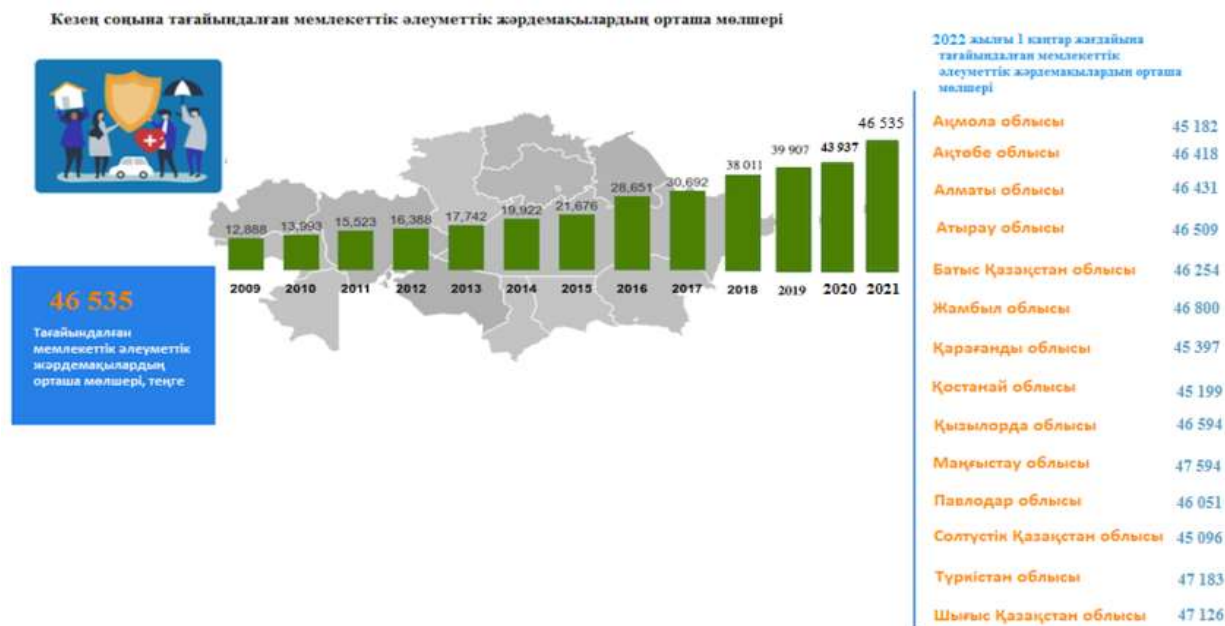
Сурет 3 - Әлеуметтік жәрдемақылар мөлшері

көмегін алған (122 337 адам) халықтың үлесін қаладағылардан 105 051, ал ауылдағылардан 17 286-ы құраған.