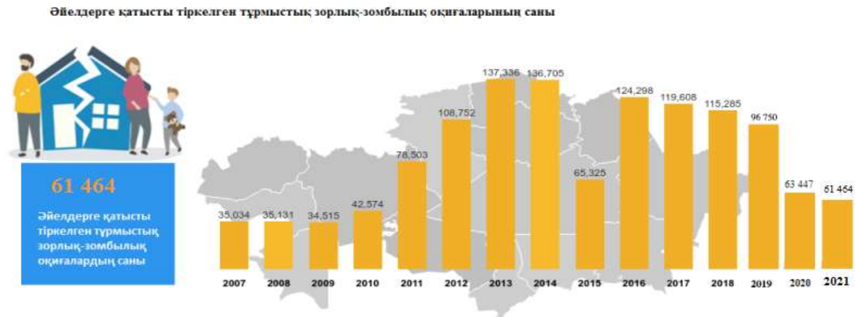
Сурет 2- Қылмыстардың өсу динамикасы

Аталған диаграммада (Сурет 2) 2007 ж (35034) әйелдерге қатысты тіркелген зорлық зомбылық оқиғаларының саны 2013 ж (137,336), 2014 ж (136,705) 3,9 есеге дейін өсіп, 2021 жылы (61 464) азайғанымен (2007 жылмен салыстырғанда) әлі күнге дейін 1,8 есе өсіп отыр. Теңсіздік индексациясын төмендегідей салалармен деталізацияланған түрінде қарастырсақ, 2021 жылғы жерге иелік ететін ересек халықтың жынысы бойынша бөліністе (меншік иелері және жер пайдаланушылар көлемі) ерлердің үлесіне 7,43% тисе, әйел баласына бар болғаны 1,55 %.